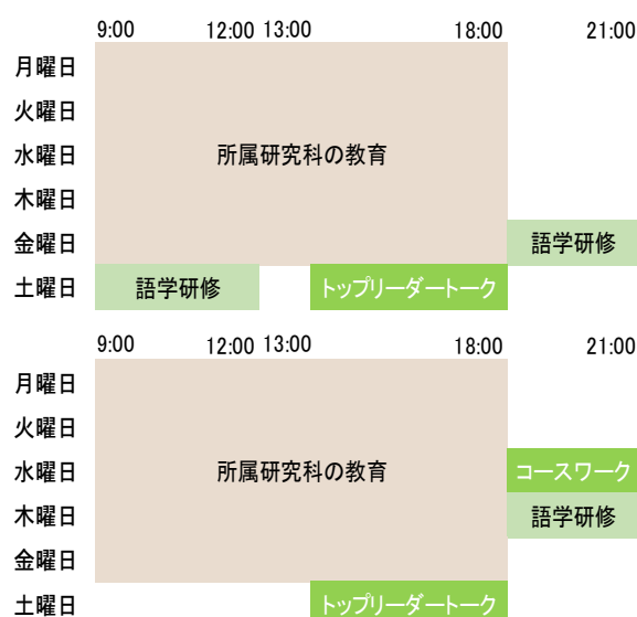
学期中のプログラム日程(イメージ)

授業期間中においては、平日の夕方以降および土曜日終日に、コースワーク・語学研修などが開講されます。トップリーダートークを含むコースワークが必修であるほか、多くのプログラムに参加する必要があります。また、夏・春の休暇期間中に海外研修が実施されますが、その多くも必修です。応募にあたっては、参加が時間的に可能であることを、指導教員とも相談の上で確認してください。