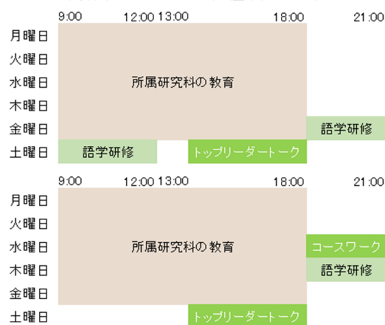
学期中のプログラム日程(イメージ)

授業期間中においては、平日の夕方以降および土曜日終日に、コースワーク・語学研修などが開講されます。トップリーダートークを含むコースワークが必修であるほか、多くのプログラムに参加することが必要になります。また、夏・春の休暇期間中に海外研修が実施されますが、その多くも必修です。応募にあたっては、参加が時間的に可能であることを、指導教員とも相談の上で確認してください。